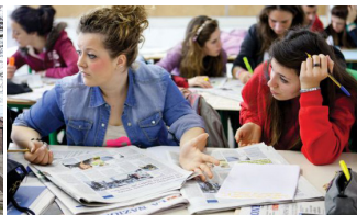
Dnevnik v razredu