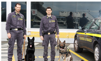
Vzgoja za legalnost